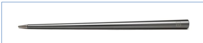
Foto 2: modello generico di colore non disponibile con il proprio astuccio

Foto 1: modello generico di colore "titanium grey"