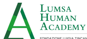
LUMSA Human Academy